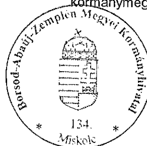
Demeter Ervin kormány megbízott